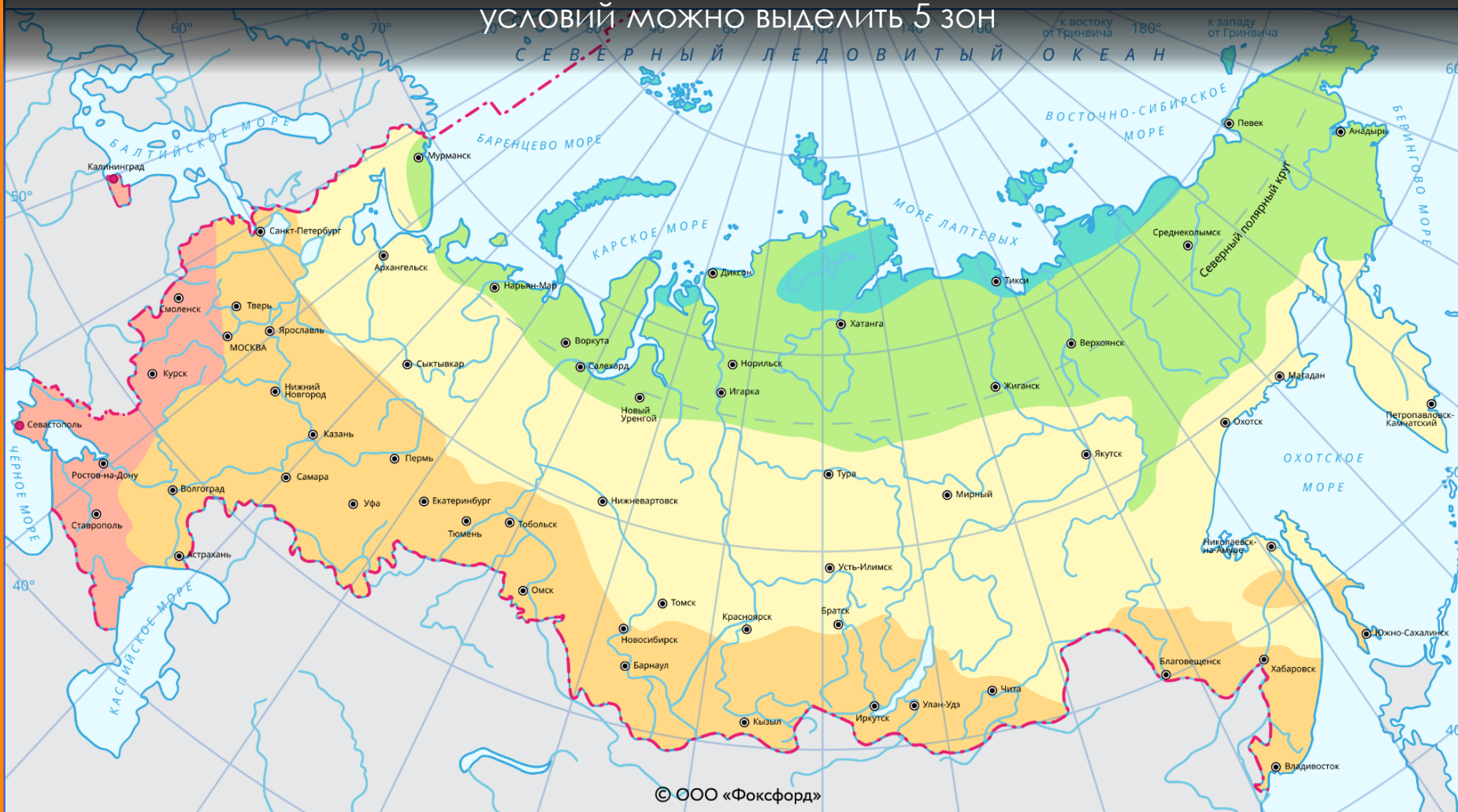
СТЕПЕНЬ БЛАГОПРИЯТНОСТИ УСЛОВИЙ ЖИЗНИ НАСЕЛЕНИЯ РОССИИ

В пределах территории России в соответствии с благоприятностью климатических условий можно выделить 5 зон