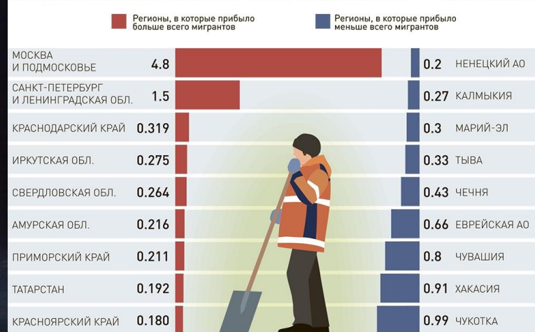
РАСПРЕДЕЛЕНИЕ ТРУДОВЫХ МИГРАНТОВ В РОССИИ ПО ИТОГАМ 2022 Г., МЛН

Это люди, сменившие место жительства в поисках лучшей работы