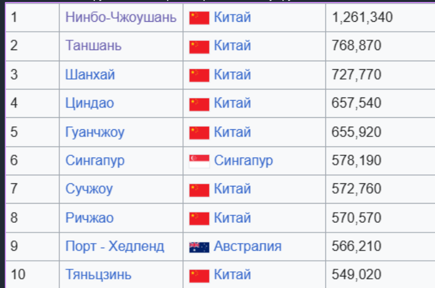
Крупнейшие порты мира по тоннажу грузов (килотонны)

Важнейшими перекрестками морских трасс являются каналы (Суэцкий, Панамский) и проливы (Гибралтарский, Ормузский, Малаккский)